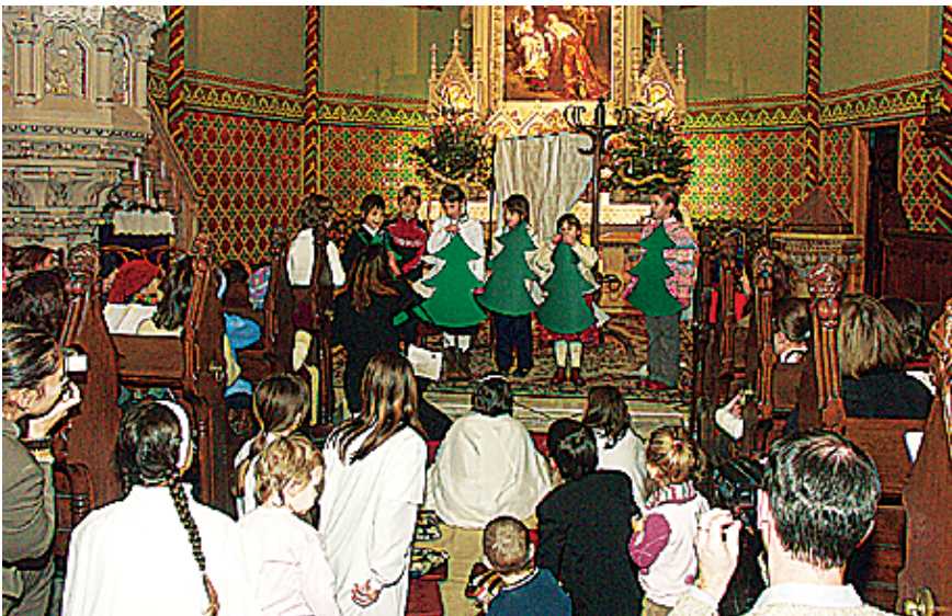
A Fasori Evangélikus templomban gyermekek- és ifjak karácsonyi ünnepségét rendezték meg december 19-én