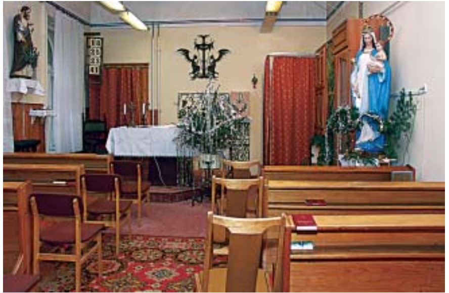
A Kis Regnum Kápolnában (képiükön) hétfőn, szerdán és pénteken reggel 7.45-kor, vasárnap és egyházi ünnepnapkor 11.30-kor van szentmise